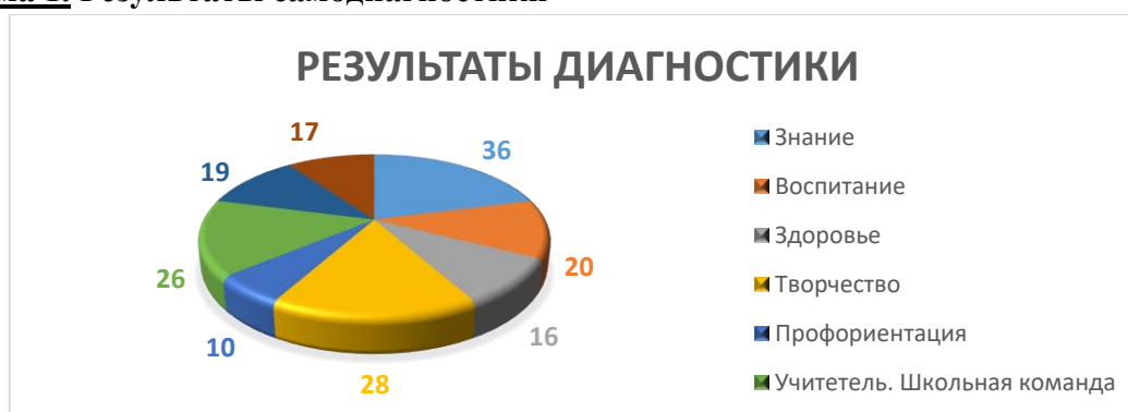
Диаграмма 1. Результаты самодиагностики

По направлениям «Творчество» -28 баллов (высокий уровень), «Воспитание» – 20 баллов (высокий уровень), по ключевому условию «Школьный климат» - 19 баллов (высокий уровень), «Образовательная среда» - 17 баллов (высокий уровень). По остальным направлениям средний уровень.