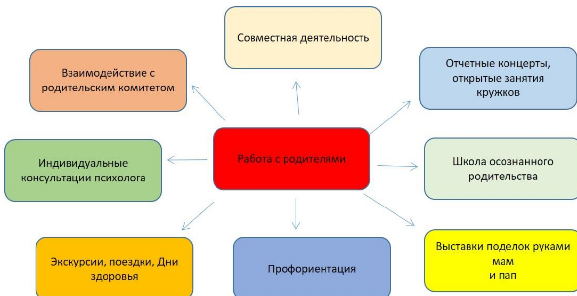
Диаграмма 3. Модель сотрудничества с родителями

Успех сотрудничества с семьями обучающихся в МОБУ «СОШ «Агалатовский ЦО» обеспечивается благодаря