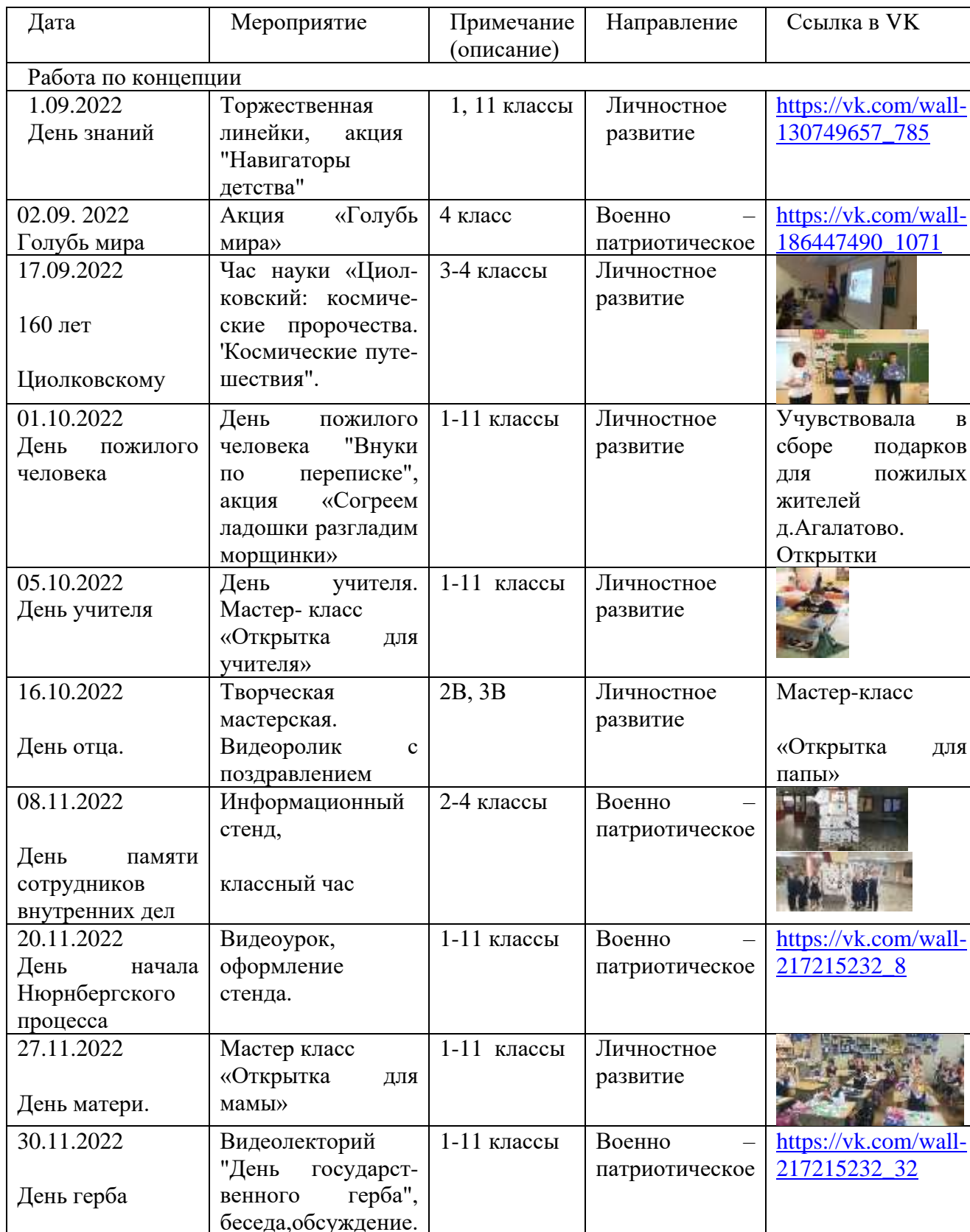
Таблица 8. Реализация мероприятий программы РДШ «Орлята России»

идентичности и неприятие идеологии терроризма; оказывают содействие в создании и деятельности первичного отделения Российского движения школьников, оказывает содействие в формировании актива школы; выявляют и поддерживает реализацию социальных инициатив учащихся общеобразовательной организации, осуществляет сопровождение детских социальных проектов; осуществляют взаимодействие с заинтересованными общественными организациями по предупреждению негативного и противоправного поведения обучающихся.