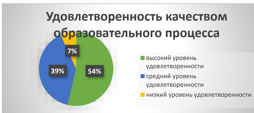
Диаграмма 3. Удовлетворенность качеством образовательного процесса

Вывод. По результатам анкетирования можно сделать вывод, что в 2022 году доля родителей (законных представителей), удовлетворенных качеством образовательного процесса и качеством условий на всех уровнях общего образования составляет в среднем 94%, что на 2% ниже, чем в 2021 году. Чтобы повысить этот результат, в 2023 году школа планирует проанализировать сложившуюся внутреннюю систему оценки качества образования и при необходимости скорректирует её. Также школа планирует скорректировать систему мотивации педагогов, которые обеспечивают стабильные и высокие образовательные результаты, в частности пересмотреть поощрение за обеспечение призовых мест во всероссийской олимпиаде школьников.