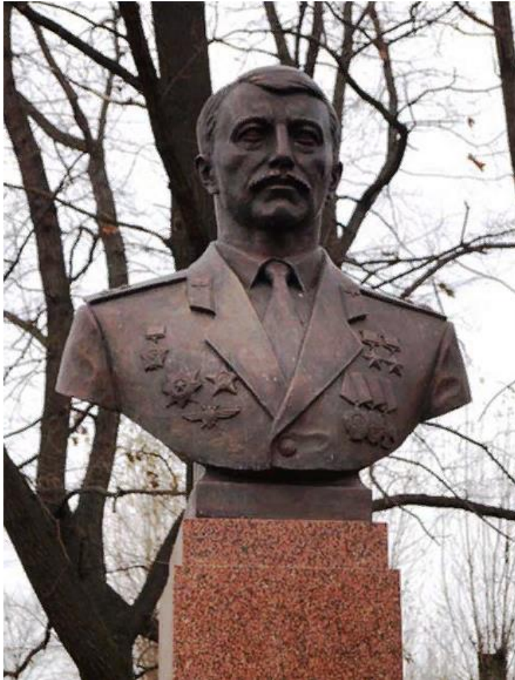
Бюст Героя Советского Союза Героя Российской Федерации полковника Николая Майданова на Аллее Героев в Московском парке Победы в Санкт-Петербурге