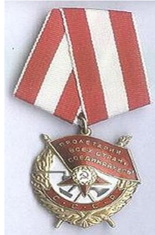
Орден Красного Знамени