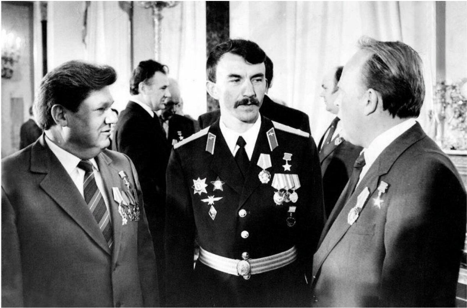
Награждение в Кремле