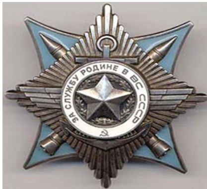
Орден "За Службу Родине в Вооруженных Силах СССР" III степени