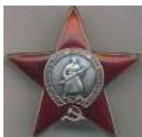
Ордена и медали моего прадеда