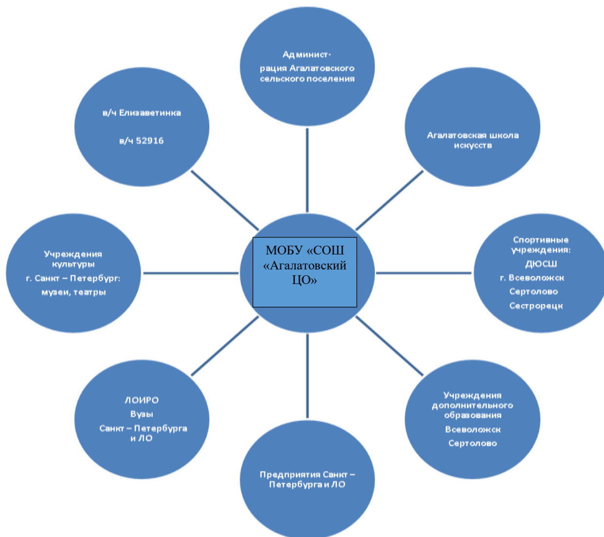
Рисунок 1 – Социальные партнёры МОБУ «СОШ «Агалатовский ЦО»